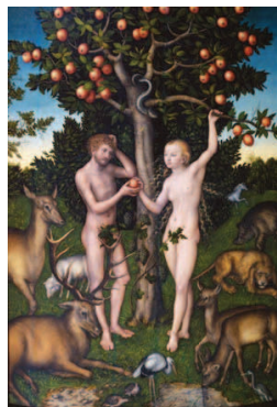
Lucas Cranach, Adam and Eve , 1526 Courtauld Institute of Art Gallery

Que deviendra la notion de vie privée dans notre société numérique ? L'hyper-mnésie et l'hyper-connectivité du net sont-elles des facteurs d'asservissement ou de libération de l'homme 3 ? Quelle sera notre responsabilité vis-à-vis de robots commandés par la pensée, quelle sera notre cohabitation avec les robots ? Que devient le courage patriotique dans une guerre entre robots 4 ? Construire des robots ressemblant à l'homme est-il tabou 5 ? Faut-il souhaiter ou redouter le transhumain, cet homme augmenté de capacités intellectuelles et physiques 6 dans un tourbillon effréné 7 ? L'évolution